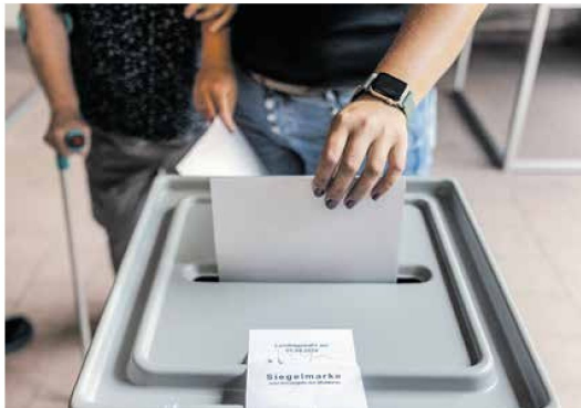
A választók erős üzenetet küldtek voksukkal Berlinbe