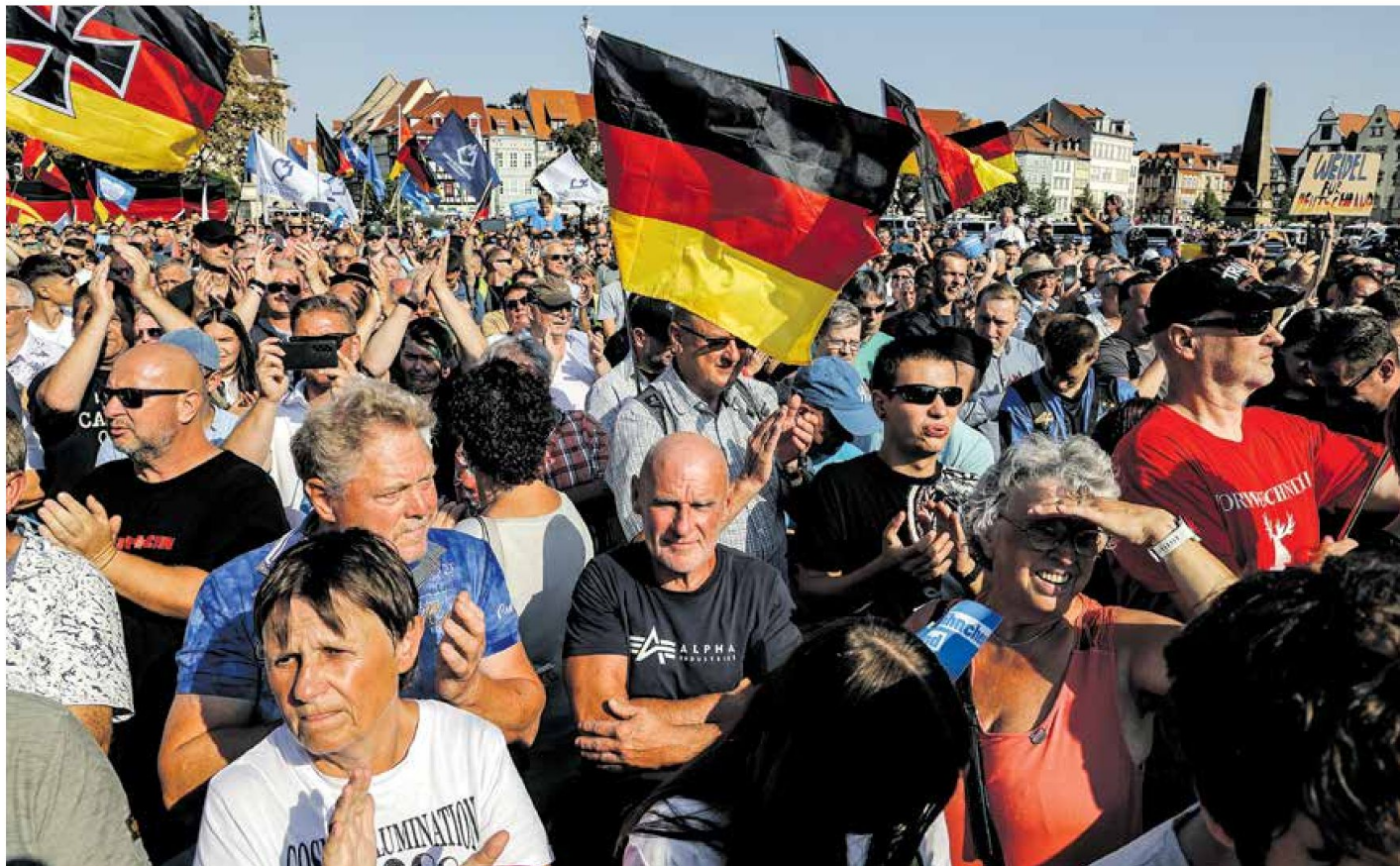
Tübingenben az első, Szászországban a második lett a tartományi választáson a jobboldali párt

Politikai karanténba zárnák a történelmi sikert elért AfD-t