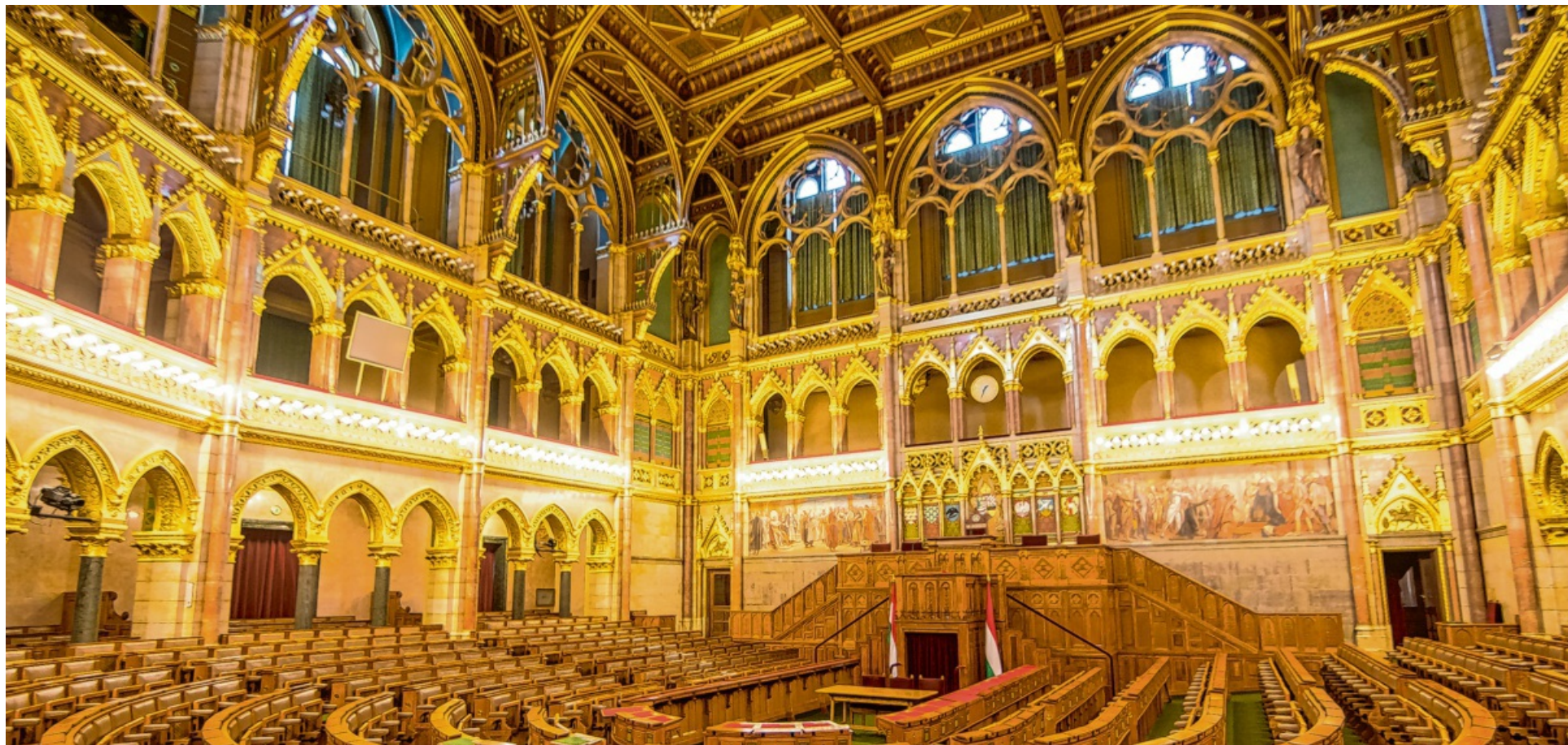
Sowohl die Regierungspartei Fidesz, als auch die Oppositionspartei Tisza haben gute Chancen, die nächsten ungarischen Wahlen im April 2026 zu gewinnen. Im Bild der Sitzungssaal im ungarischen Parlamentsgebäude.

Diese Vorgeschichte ist wichtig, um die politische Gegenwart zu verstehen. Aufgrund des Ukrainekrieges und der schwächelnden deutschen Wirtschaft leben die Ungarn heute nicht viel besser als vor vier Jahren. Eine Wiederwahl nach 16 Regierungsjahren ist immer eine Herausforderung. Darüber hinaus ist der Herausforderer, Péter Magyar, kommunikativ talentiert, gilt jedoch als aggressiv und stand bis 2024 selbst der Fidesz nahe – dies schadet seinem