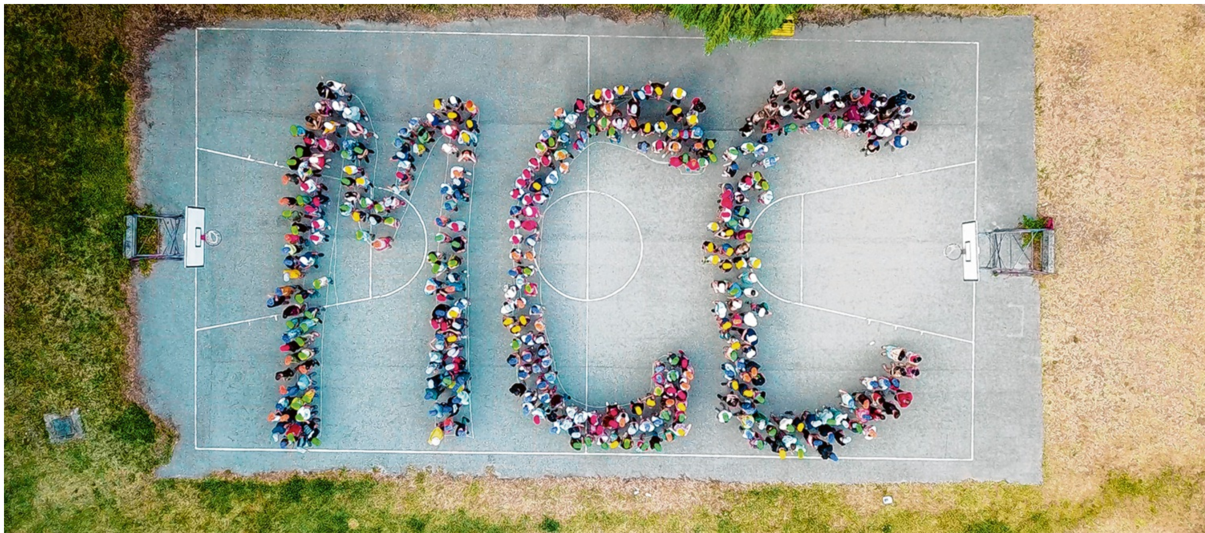
Das Mathias Corvinus Collegium basiert auf drei Säulen: engagierte Studierende, gezielte Begabtenförderung und ein starkes Gemeinschaftsgefühl.