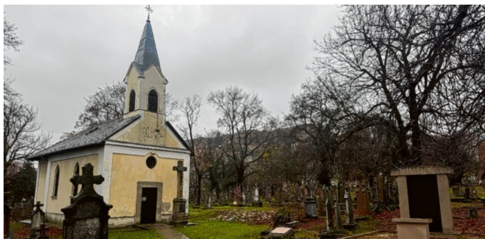
Am 19. Januar 1946 verließ der erste Deportationszug den Bahnhof von Budaörs (Wudersch) nahe Budapest und begann damit die Zwangsumsiedlung der Ungarndeutschen.

Am 19. Januar 1946 verließ der erste Deportationszug den Bahnhof von Budaörs nahe Budapest und begann damit die Zwangsumsiedlung der Ungarndeutschen. Zwischen 1946 und 1948 wurde die Hälfte der deutschen Gemeinschaft, bis 230 000 Menschen, gegen ihren Willen aus Ungarn deportiert, größtenteils in die amerikanische und etwa ein Fünftel in die sowjetische Besatzungszone Deutschlands. Dies geschah aus dem Prinzip der Kollektivschuld unter Verweis auf eine pauschale Schuldzuweisung. Ihnen wurde vorgeworfen, in den Kriegsjahren Hitlers Vorhut gewesen zu sein und sich als „faschistische Überbleibsel“ zu verhalten, die keine Gnade verdienen. Im Gegensatz zu den Juden wurden die Deutschen in Ungarn zwar nicht in Viehwaggons in den Tod transportiert, aber auch sie wurden vom Staat ihrer Lebensgrundlage und ihrer Würde