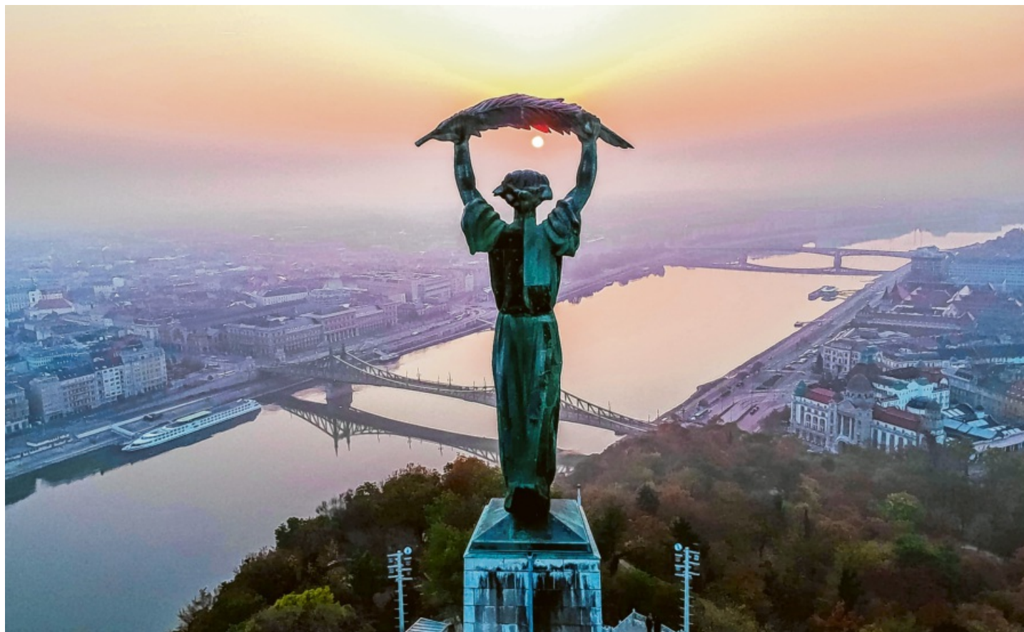
Im Licht der untergehenden Sonne erhebt sich die Freiheitsstatue auf dem Gellértberg in Budapest – ein Symbol dafür, dass manche Werte in Ungarn Bestand haben.

Auch für Juden ist Budapest eine der sichersten Städte Europas. In Westeuropa sind sie tätlichen Angriffen ausgesetzt. In Deutschland nahmen antisemitische Vorfälle von 2021 bis 2023 um 75 Prozent zu, in Frankreich um 185 Prozent und in Großbritannien um 82 Prozent (laut Anti-Defamation League, 2025), während solche Vorfälle in Ungarn selten sind – so dass israelische Fußballspiele aus Sicherheitsgründen oft in Budapest stattfinden. Diffuse Vorurteile gibt es auch hier, doch die Regierung verfolgt jedoch gegen Antisemitismus seit Jahren