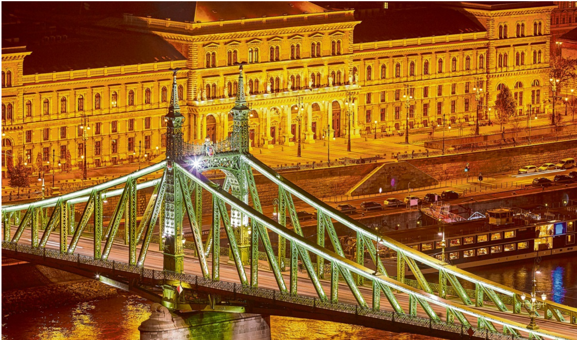
Talentförderung baut Brücken zwischen Wissen und Zukunft – im Vordergrund eine der führenden Hochschulen Ungarns, die Corvinus-Universität und die Freiheitsbrücke in Budapest.