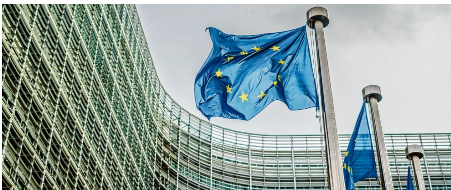
Ungarn ist überzeugt, dass die EU nur erfolgreich sein kann, wenn die Mitgliedstaaten ihre eigene Identität bewahren können; für das Land gilt das Prinzip „Einheit in Vielfalt“.

Diese Haltung zieht Konflikte mit EU-Institutionen nach sich, deren Ziel die stetige Ausweitung der eigenen Kompetenzen ist. Die Ungarn reagieren jedoch – auch aufgrund historischer Erfahrungen – empfindlich auf Beschneidungen der nationalen Souveränität. Ungarn strebt vielmehr den Erhalt der jüdisch-christlichen Wurzeln Europas sowie der ungarischen und europäischen Identität an. Unter anderem aufgrund dieser Überlegungen bezog Ungarn bereits 2015 einen migrationskritischen Standpunkt. Mittlerweile zeigt sich immer deutlicher, dass die EU durch die illegale Migration nur schwächer und unsicherer geworden ist. Ungarn schützt getreu seiner vertraglichen Verpflichtungen die EU-