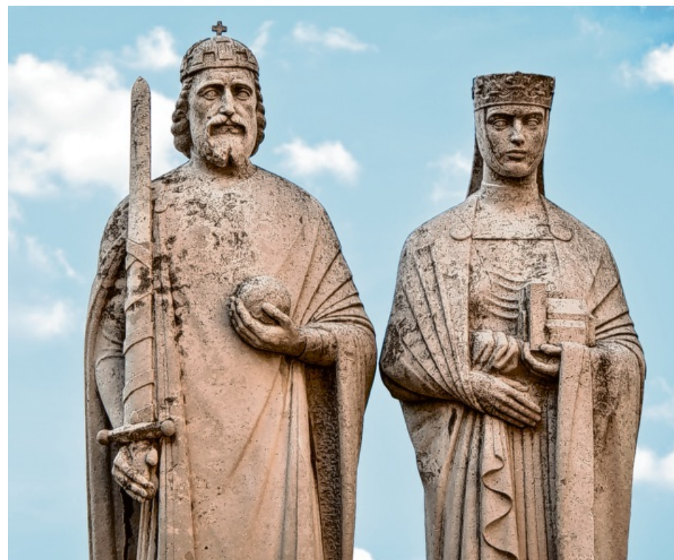
Auf den Spuren von Stephan dem Heiligen und Gisela von Bayern – ein Band zwischen Deutschland und Ungarn, das seit über tausend Jahren besteht.