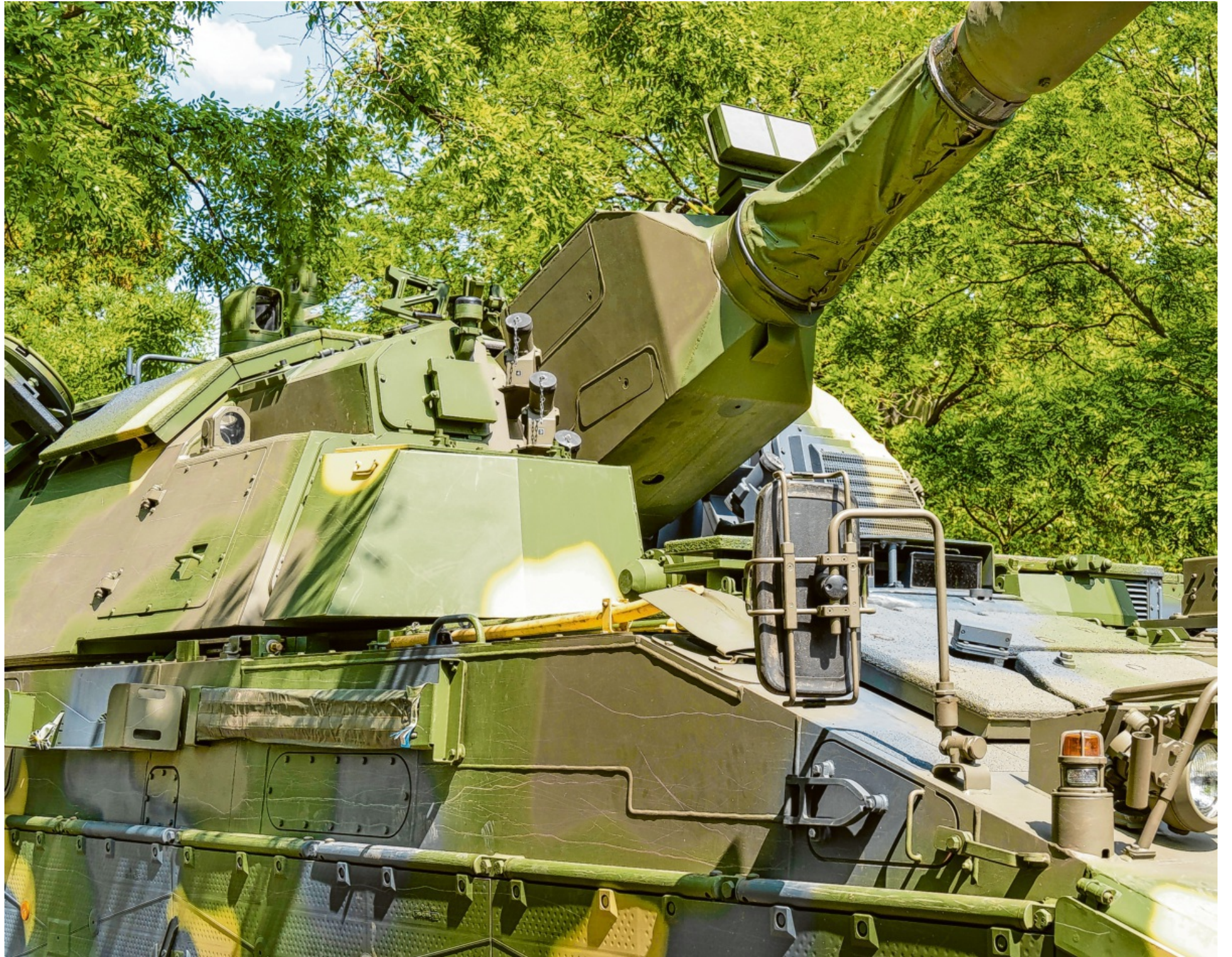
Besonders hervorzuheben ist das deutsch-ungarische Kooperationsprojekt mit Rheinmetall, das sowohl die Produktion des modernen Schützenpanzers Lynx in Zalaegerszeg als auch eine Munitionsfabrik in Várpalota umfasst.

Von Anfang an wurde bei der Ausarbeitung des Modernisierungsprogramms der enge Schulterschluss mit den deutschen Streitkräften und dem deutschen Verteidigungsministerium gesucht. Bereits 2017 fanden hierzu erste Gespräche statt, wesentlich war das Treffen zwischen Ministerpräsident Orbán und Bundeskanzlerin Merkel am 5. Juli 2018 in Berlin, bei dem die Bundeskanzlerin die enge Kooperation zwischen Deutschland und